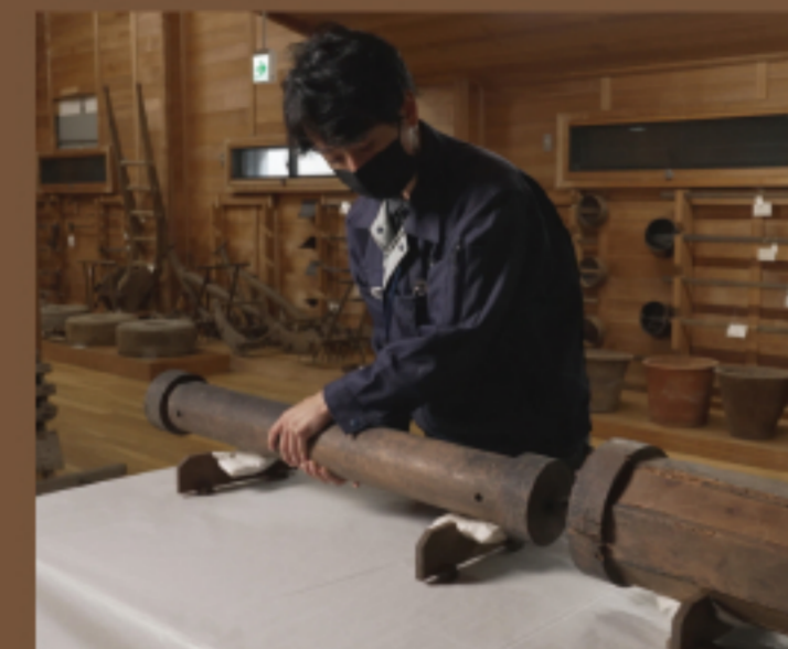
久米通賢旧宅の屋根裏から 発見された火筒の木型