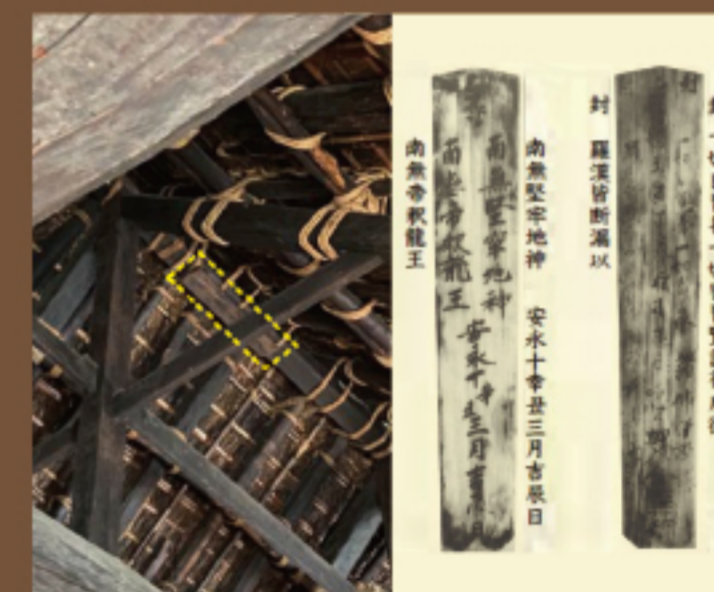
下木家住宅が1781年(安永十年)に 建てられたことを記す「棟札(むなふだ)」