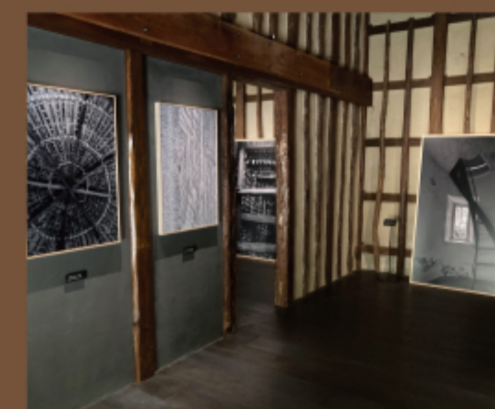
写真家・新津保健秀氏による四国村 ミュージアムの「肌理(きめ)と造形」