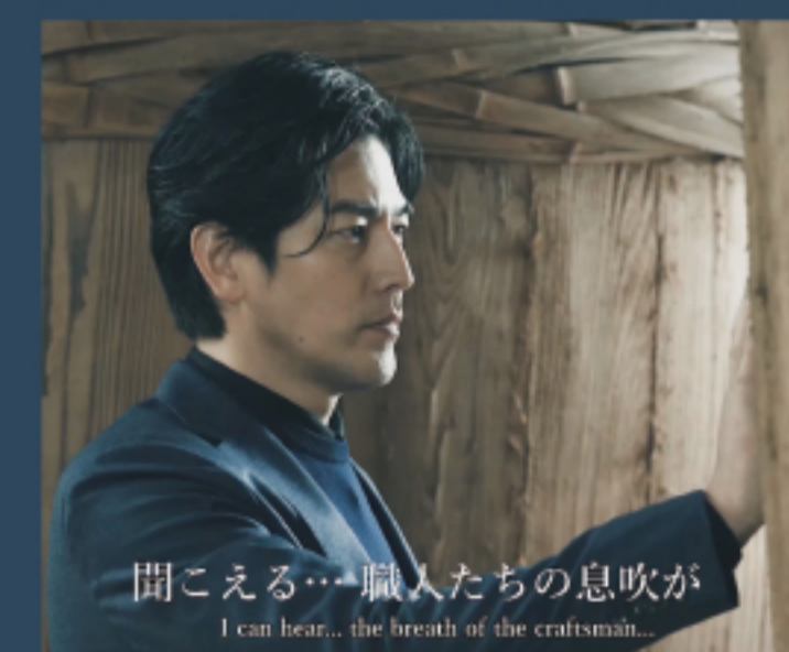
聞こえる…職人たちの息吹が I can hear... the breath of the craftsman...