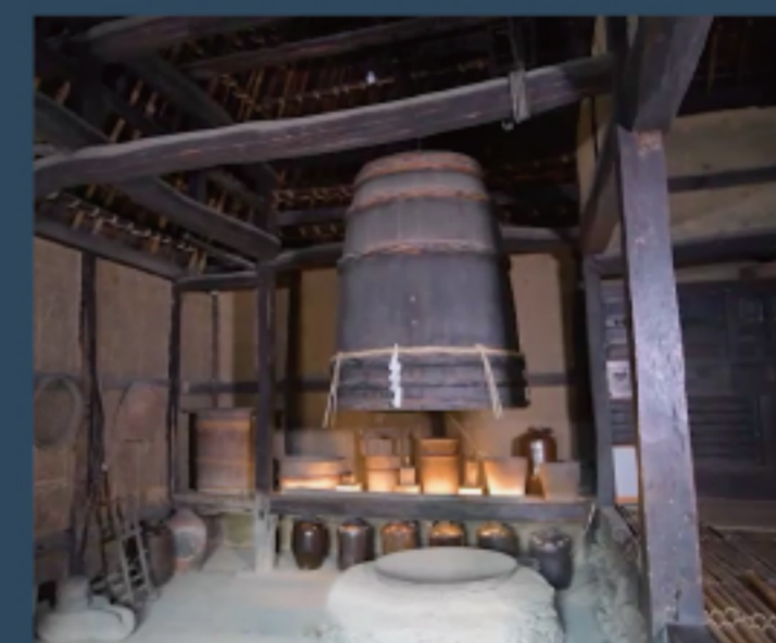
楮(こうぞ)から紙をつくる ～楮蒸しの歴史～