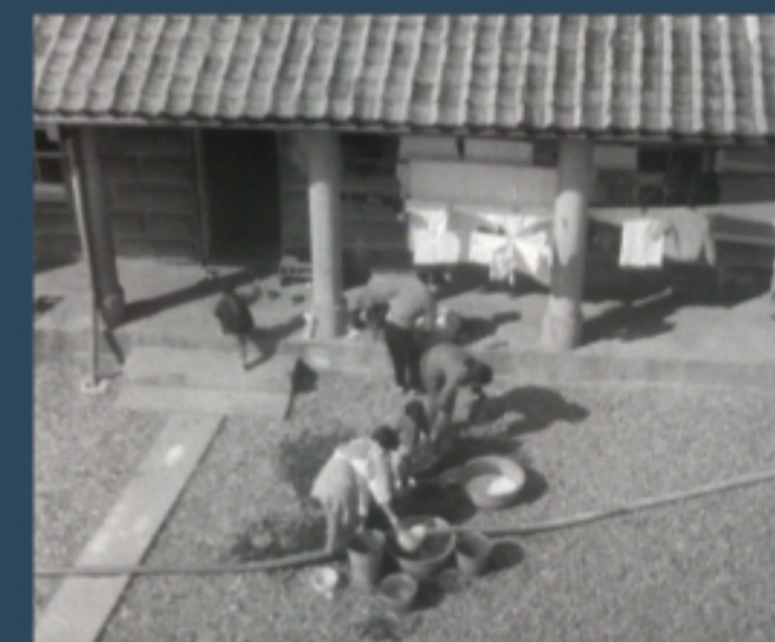
灯台守の 退息所での暮らし

証言や再現ドラマにより、その建物で暮らした人々の営みが、より詳しく分かるようになりました。