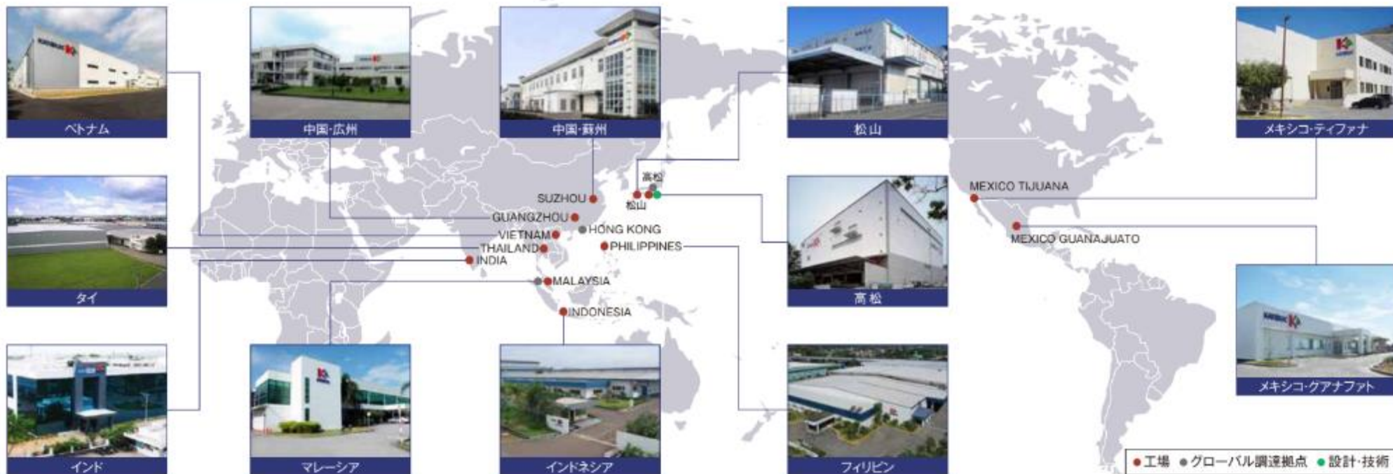
[グローバル生産拠点と調達拠点]

国内外9か国、12カ所の工場で同一レベルの高いサービスを提供。自動車から家電まで幅広い分野の電子機器の生産を受託しています。事業環境の変化に合わせたスムーズな生産移管など、フレキシブルな対応でお客様の海外戦略を強力にサポートします。