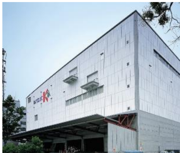
※グローバルEMSセンター

◎ISO 9001:2015 (グローバルEMSセンター、グローバルEMSセンター第2オフィス)