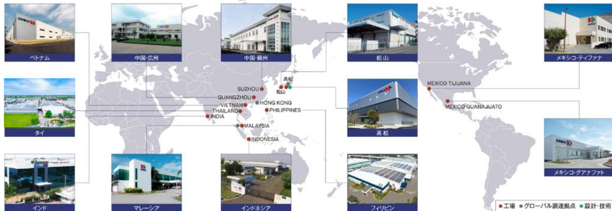
【グローバル生産拠点と調達拠点】

事業環境の変化に合わせたスムーズな生産移管など、フレキシブルな対応でお客様の海外戦略を強力にサポートします。